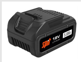
Eurocode 054551 Batterie 18V - 5Ah