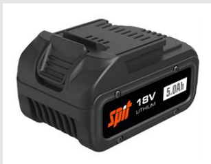
Eurocode 054551 Batterie 18V - 5Ah