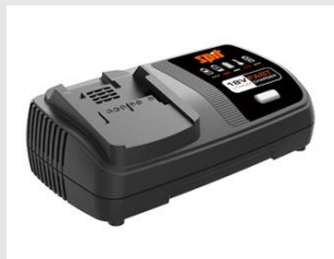
Eurocode 054553 Chargeur rapide 18V