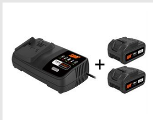
Eurocode 054548 Pack énergie 18V - 5Ah