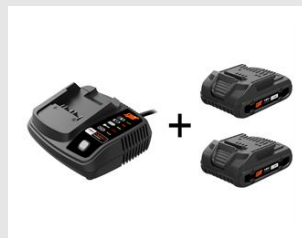
Eurocode 054547 Pack énergie 18V - 2Ah