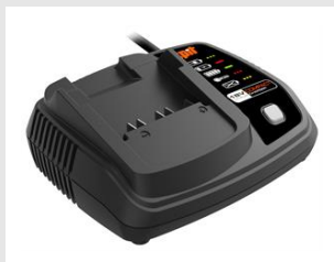
Eurocode 054552 Chargeur compact 18V