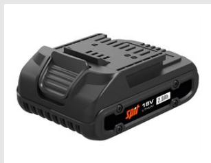
Eurocode 054550 Batterie 18V - 2Ah