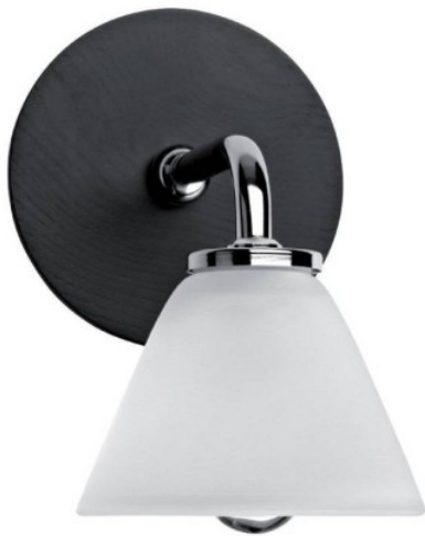
Applique murale intérieure BEMOL 1 Aric - Halogène 20W - IP24 - Wengé Réf 0752