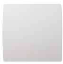
GRAPHIC vue de face