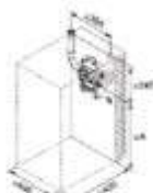
Encadrement brosses mural centrale installée