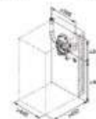
Encadrement brosses mural centrale installée