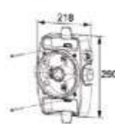
Encadrement brosses mural