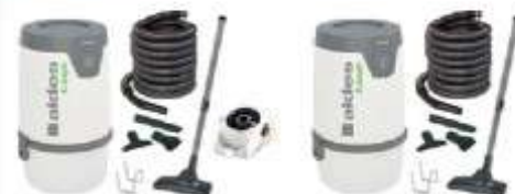
Pack centrale C.Axpir® Initia avec brosses mural / Pack centrale C.Axpir® Initia sans brosses mural