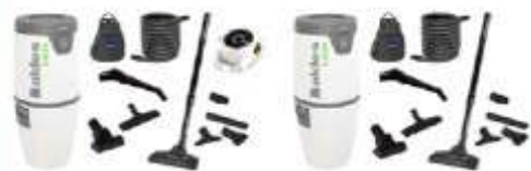
Pack centrale C.Axpir® Comfort avec brosses mural / Centrale d'aspiration C.Axpir® Comfort sans brosses mural