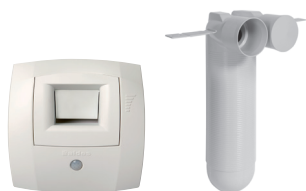
Kit Hygro extraction WC