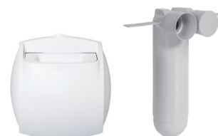
Kit Auto extraction sanitaire