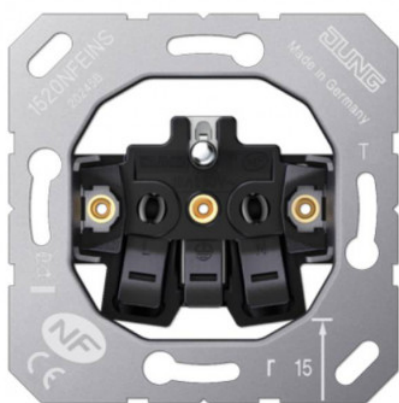
Mécanisme prise KNX Jung Réf 1520NFEINS