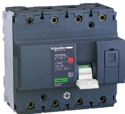
Interrupteur-sectionneur NG125NA - Acti9 - 4P - 80A Réf 18898