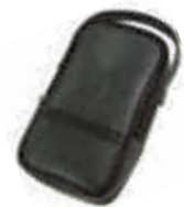
9079 Sacoche souple