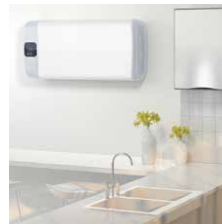
TABLEAU DE COMMANDE INTELLIGENT