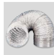
GSA-100 Conduit flexible aluminium.