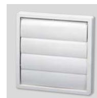
PER-100W Grille extérieure aluminium.