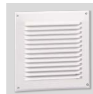
GRA-75 Grille plastique.