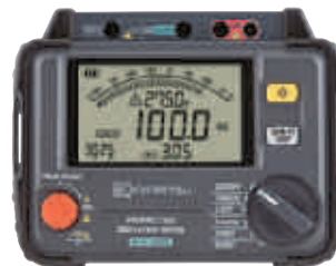
3025A 100GΩ 250V-2500V