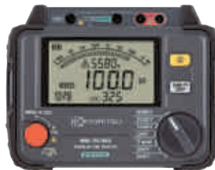
3125A 1TΩ 250V-5000V