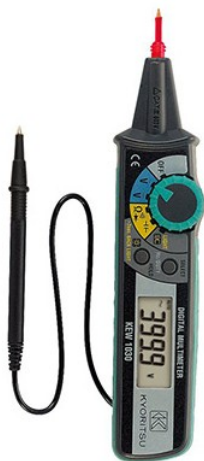
Multimètre numérique VCA/VCC/ Réf K1030