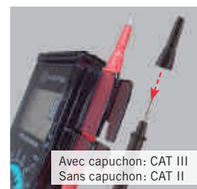
Avec capuchon: CAT III Sans capuchon: CAT II