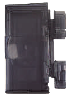
9188 Etui rigide