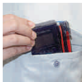
Capuchon détachable, CAT III