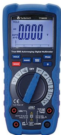
Multimètre Pro 1000V/10A TRMS Réf TT9660B