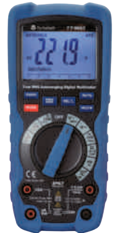
TT9663 & TT9664