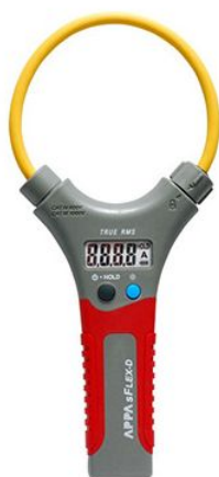
Pince Flex 3000A TRMS Réf FLEX10D