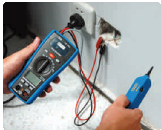
Tester sans assistance le câblage dans l'armoire en connectant simplement les pincettes crocodile aux gaines aux prises de contact.