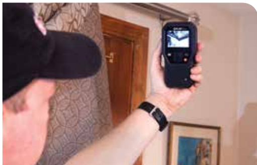
Recherche de problèmes d'humidité au niveau des raccords entre mur et plafond avec le FLIR MR160.