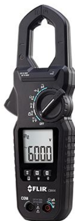
Pince multimètre Pro 400Aca Réf CM44