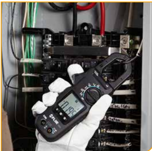
La technologie Accu-Tip permet des mesures plus précises de l'ampérage