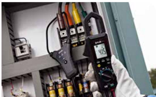
Réalisez des mesures compliquées en toute facilité grâce à la pince flexible TA74 en option