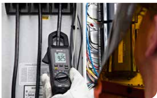
Mesure d'intensité efficace jusqu'à 600A