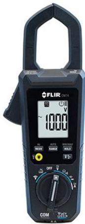
Pince multimètre Pro - 600A Réf CM74