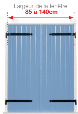
Un volet à 2 battants , poids maximum de 30kg par battant