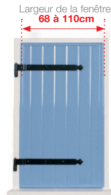
Un volet à 1 seul battant gauche , poids maximum de 30kg