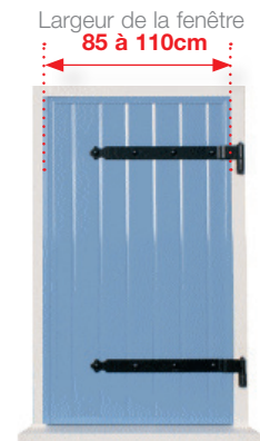
Un volet à 1 seul battant droit , poids maximum de 30kg