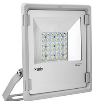
Projecteur extérieur Twister 3 - Asymétrique - Gris - 100W - 3000K Réf 50872