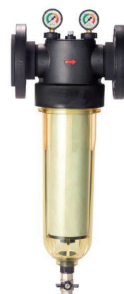
3. Filtre à tamis polypropylène de 1"1/4 à 3"