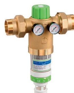
2. Filtre à nettoyage manuel 1"1/2 et 2"