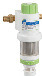
1. Filtre à nettoyage manuel de 3/4" à 1"1/4

Ils offrent une finesse de filtration de 25 microns. Les tamis doivent être changés à intervalles réguliers (entre 3 et 6 mois suivant utilisation).