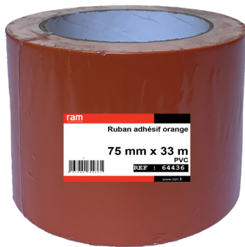
Ref 64436 : Ruban Adhésif 75mm x 33m