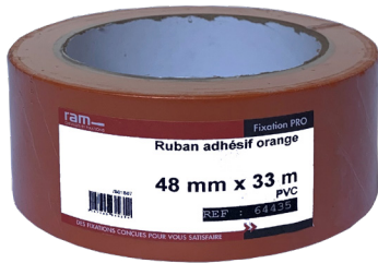
Ref 64435 : Ruban Adhésif 48mm x 33m