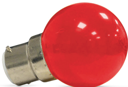
Ampoules incassables (globe en polycarbonate)