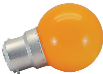
Ampoules incassables (globe en polycarbonate)