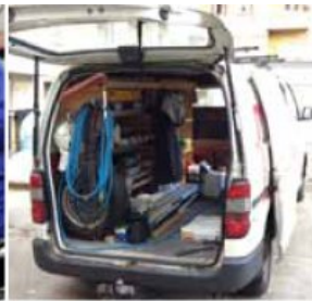
VÉHICULE DE SERVICE