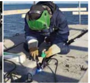
... ET OÙ QUE VOUS SOYEZ