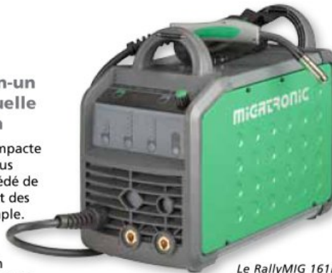
Le RallyMIG 161i ne pèse que 13 kg.

La machine multifonction, compacte et portable RallyMIG 161i vous permet de sélectionner le procédé de soudage de votre choix du bout des doigts – MIG, MMA et TIG simple. Partout. A tout moment. Cette machine monophasée (230 V), dotée de la correction du facteur de puissance (PFC), vous offre la possibilité de connecter de longs câbles d'alimentation ou d'utiliser un générateur.