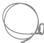
Fillin de sécurité x2