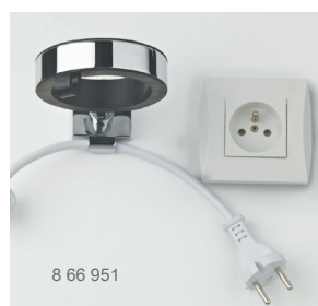
8 66 951