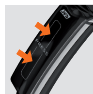
SYSTÈME DE POIGNÉE INTERRUPTEUR BREVETÉ