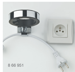
8 66 951

POSSIBILITÉ DE VERROUILLER LE CÂBLE D'ALIMENTATION AVEC LE SUPPORT MURAL CHROME