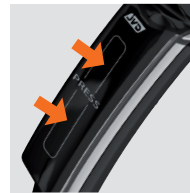
SYSTÈME DE POIGNÉE INTERRUPTEUR BREVETÉ