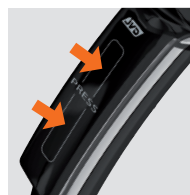
SYSTÈME DE POIGNÉE INTERRUPTEUR BREVETÉ