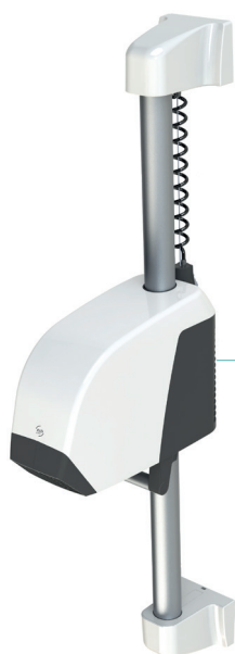
REF 8 22 1405 Sèche-cheveux Neptune blanc