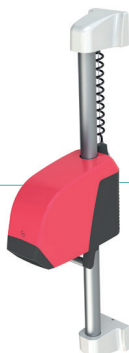
REF 8 22 1407 Sèche-cheveux Neptune rouge

Sèche-mains pour piscines et salles de sport, résistant en atmosphère chlorée et pourvu d'un moteur à induction pour une utilisation intensive. Hauteur réglable et ergonomique (rotation à 180°). Garantie 3 ans pièces et main d'oeuvre.