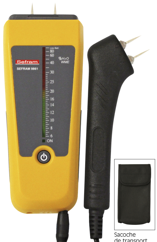
Sacoche de transport

Livré avec : pile, manuel, couvercle de protection, sonde déportée avec câble de longueur 1m, sacoche de transport.