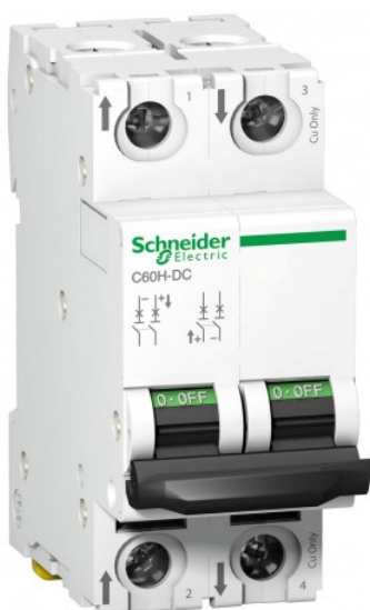
Disjoncteur modulaire miniature C60H-DC Acti9 - 2P - 2A - Courbe C Réf A9N61522