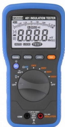
Mesureur d'isolement Finest Réf F401