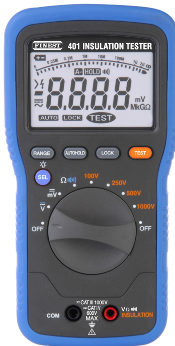
F401 : mesureur d'isolement numérique