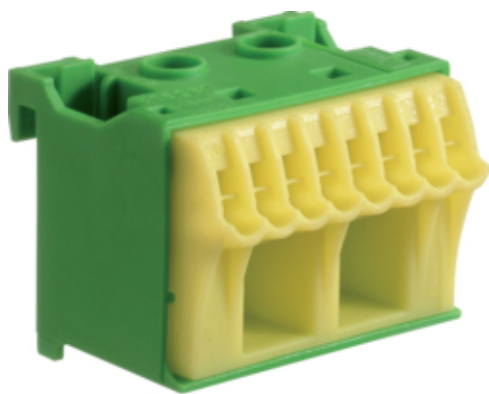
Bornier terre sanvis 8x4mm 2 + 2x25mm 2