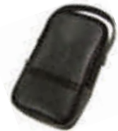
9079 Sacoche souple