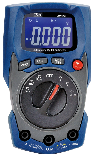
TT960 : Multimètre numérique TRMS compact