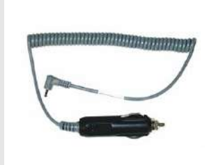
Eurocode 900507 Adaptateur voiture de chargeur