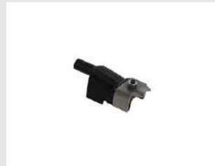
Eurocode 019785 Palpeur tuile IM90Xi