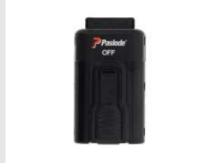
Eurocode 018880 Batterie Paslode Lithium