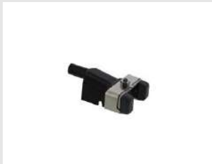
Eurocode 019783 Palpeur bardage IM90Xi