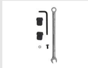
Eurocode 013256 Ens. Palp.Bard.NO-MAR SERIES-i