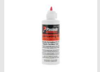
Eurocode 401482 Huile IMPULSE