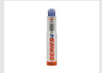
Eurocode 300348 Blister 1 cartouche IM90i / Ci