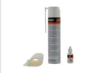
Eurocode 013690 Kit de nettoyage IMPULSE / PULSA