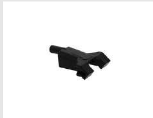
Eurocode 019784 Palpeur languette IM90Xi