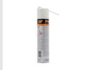
Eurocode 115251 Nettoyant IMPULSE & PULSA 300 ml