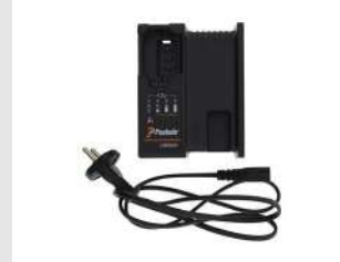
Eurocode 018881 Chargeur Paslode Lithium EU