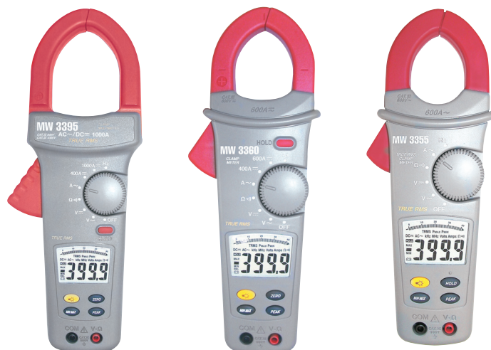
MW 3395 MW 3390 MW 3380

• Confort : équipées d'une nouvelle génération d'afficheur rétro-éclairé avec un bargraph curviligne et de grande dimension, ces pinces apportent un confort d'utilisation inégalé.