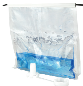
Gel bi-composant en sachet 420 ml (N706)