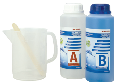
Gel bi-composant en bouteille 1l (N707)