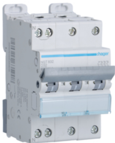
Disj.3P+N 6-10kA D-32A 3m