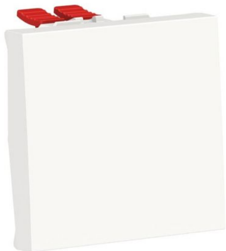
Permutateur Unica - 2 modules - 10AX - Blanc Réf NU320518