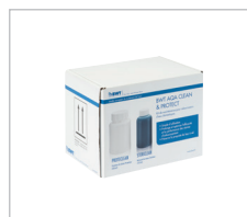
AQACLEAN & PROTECT