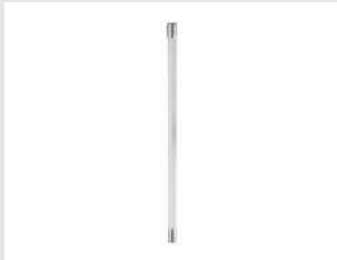
Eurocode 018849 Rallonge perche E-Lift 75cm