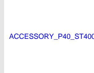
Eurocode 019336 Batterie PULSA 40 / P800 / IF / ST4