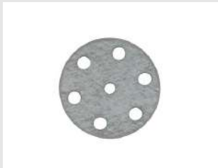
Eurocode 011204 Rondelle PULSA D.25