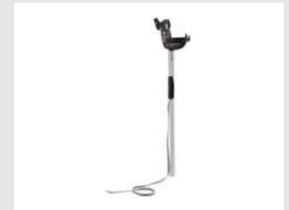
Eurocode 018820 Perche Palsa E-Lift P40 / P800