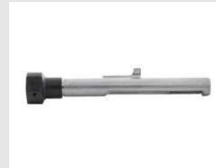
Eurocode 014642 Ensemble guide tampon magnet P800E