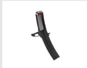
Eurocode 019683 Magasin 50 clous PULSA 40