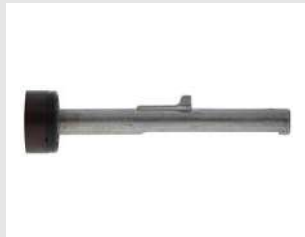
Eurocode 014641 Ens. porte rondelle P800-P40