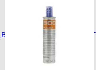
Eurocode 011773 Bli. 2 CART. GAZ PULSA / ST400i