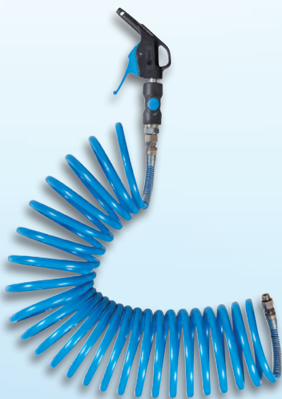
Raccords fixes aux deux extrémités du tuyau spiralé