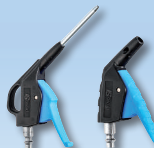
Produits associés : IBG 06MTL – IPG 06OSH